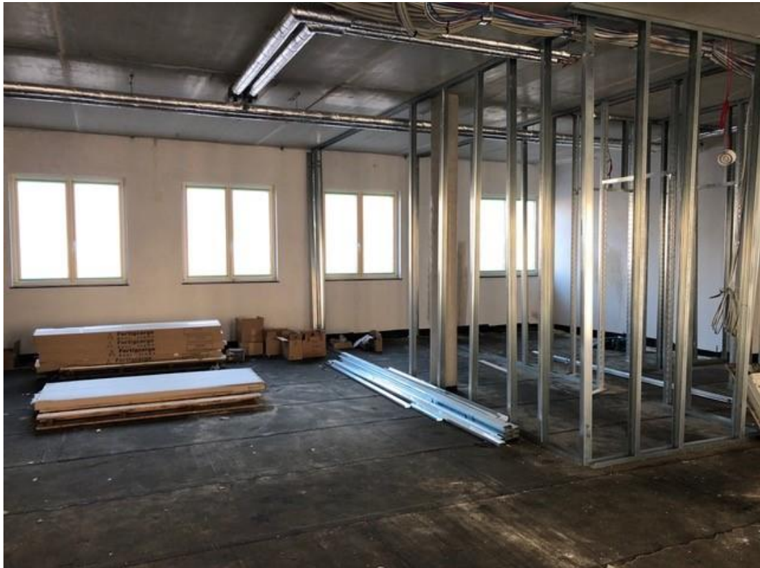
Objektbild Rohbau Selbstgestaltung der Räumlichkeiten möglich