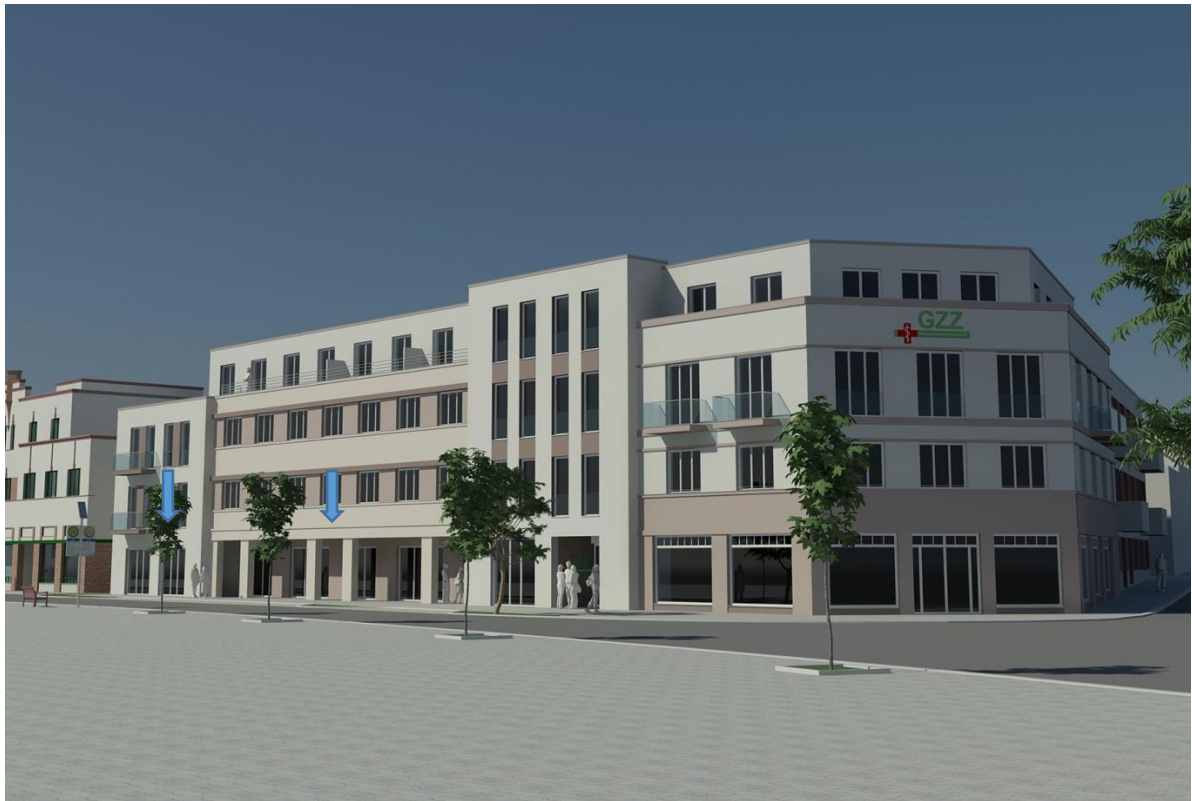
Neubaubjekt Kennzeichnung verfügbare Gewerbeflächen